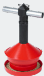
MANGEOIRE BASSE AVEC COUVERCLE

Accessoires ► La collerette pour dindes et la grille pour pintades permet une installation sans démonter le nourrisseur.