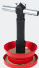
MANGEOIRE BASSE + HAUTE