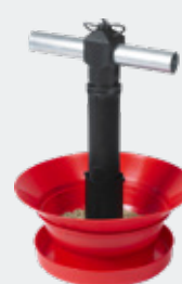
MANGEOIRE HAUTE AVEC COLLERETTE