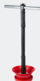
MANGEOIRE HAUTE AVEC COLLERETTE